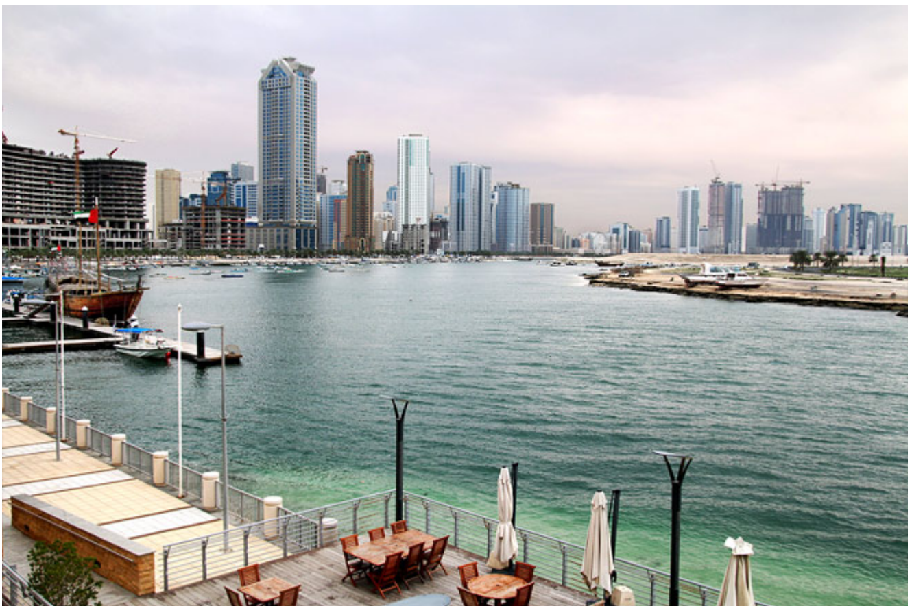
انتقال بار با لنج در بستری مدرن صورت می گیرد